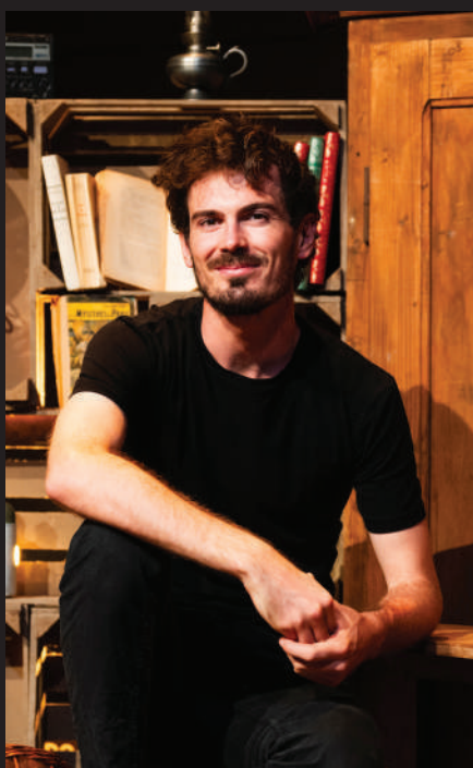
Instagram @pannatiernathan @compagniedyade

Aujourd'hui, avec la Compagnie 100 Noms, elle souhaite raconter ses propres histoires, partager ses questionnements et ses émotions avec le public. Avec L'Héritier , elle signe sa première création originale professionnelle mêlant l'écriture à la mise en scène.